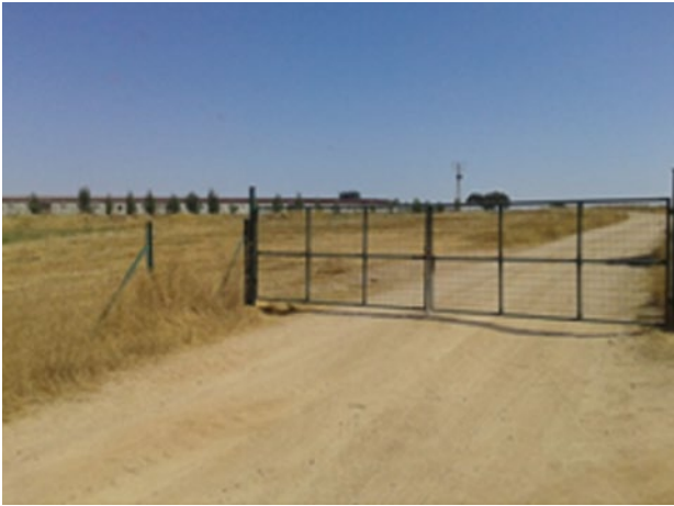
Entrada a la granja.

Ubicada en el término municipal de La Roca de la Sierra, provincia de Badajoz, se encuentra la explotación porcina Morantes. Explotación con una capacidad de 750 reproductoras, 15 verracos y 2.000 plazas de cebo. Está integrada desde sus inicios en el 2010 con Inga Food SA. Está asentada en una finca de 1.000 Ha, donde convive con otras actividades ganaderas y agrícolas, rodeada de llanos y de dehesa, la parcela de la granja cuenta con más de 8 Ha.