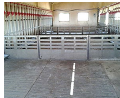
Cuarentena. Alimentación seca con dosificadores.