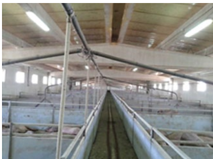
Cebo intensivo de la granja. Alimentación líquida; llegan a alcanzar índices de conversión de 4-4,2.