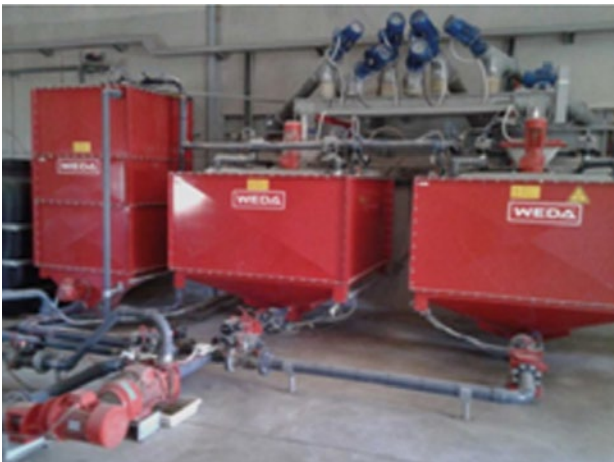
Soperas donde se mezcla agua y pienso ubicadas en la nave llamada cocina de la granja.

Excepto los verracos y los lechones en los destetes, el resto de animales tienen alimentación líquida: se les dispensa directamente el pienso mezclado con el agua.