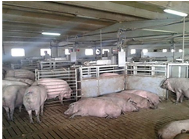
Cada reproductora está identificada con un microchip y tiene asignada una ración. Al pasar por la máquina se lee el microchip y se le suministra su ración (en el caso que no se la halla comido aún o le quede algo por comer).